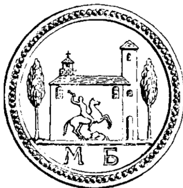
Печат Манастира Боговађа с краја XVIII века