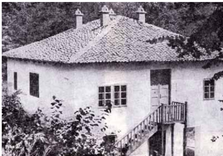
Стари конак манастира у Боговађи

кроз овај тунел могло лако стићи до непрегледне шуме. Подрум је зидан много раније, а касније су му додате две просторије и ходник.