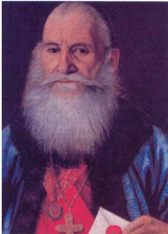
Прота Матеја Ненадовић