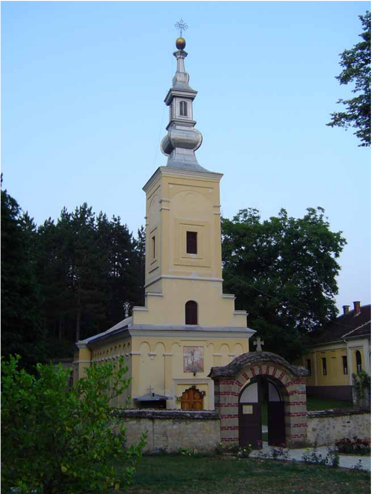
Манастир Боговађа средином XX века