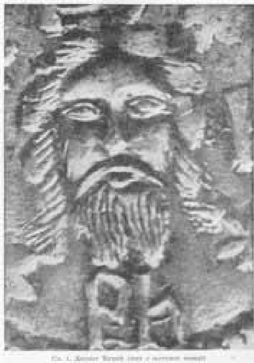
Деспот Ђурађ Бранковић

одмах по његовом завршетку. "Мали град" је имао укупно шест кула и на једној од њих од узиданих опека урађен је чувени натпис о зидању града где се каже: "У Христа бога благоверни деспот Ђурађ, господин Србљем и Поморију зетскоме. Наредбом његовом сазида се град овај у лето 6938" . Касније су настављени радови на тврђави тако да је саграђен "Велики град" који је имао још додатних осамнаест кула. Због своје величине и нарочито због брзине којом је грађен, Смедеревски град је изазвао страшну мржњу међу Ђурђевим поданицима, јер је праћен многобројним жртвама. Овим радовима је у потпуности руководио Ђорђе (Георгије) Кантакузен, рођени брат Ђурђеве жене Јерине. Баш у време док је трајала изградња Смедерева, претпоставља се у лето 1429. године, Ђурађ је крунисан за деспота. Обред је обављен у Жичи, а из Византије је знаке деспотског достојанства донео Георгије Филантропен којег је послао византијски цар Јован VIII. Са њим је заједно крунисана и Јерина која је тиме добила чин деспотице. Од тада Ђурађ носи назив "по милости божјој Рашког краљевства деспот и Албаније господар" .