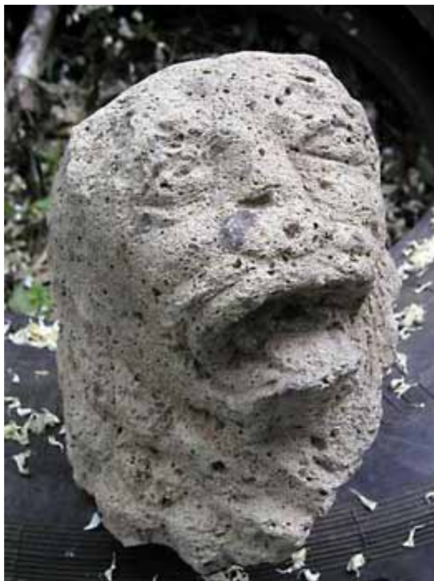
Са локалитета Анине

Према археолошким испитивањима споменуте Анине су Римски локалитет. Зна се на основу истраживања, стручних и аматерских, да је код данашњег ушћа Љига у Колубару, на његовој десној обали, формирано у четвртм веку нове ере, римско насеље. Материјални налази су показали да је реч о организованом и великом насељу. Назив локалитета “ Anine “ долази од латинске речи “ An “ – година, што значи да је насеље служило неком римском великодостојнику за годишњи тј. летњи одмор. Поред насеља из правца Пепељевца пролазио је пут и настављао ка Жупању где се још могу видети остаци римског моста. Комплекс се простире на 70 хектара земљишта поред Љига и Колубаре. По неким у старо турско доба ту је постојао мост Кулин Капетана - прелаз преко реке са кулама стражарама и ханом за путнике. По хановима место је добило назив Аниште. За неколико десетина година, колико је постојало римско насеље, у њему се одвијао динамичан живот : нађен је комплет ливачког алата, хируршки и зубарски инструменти, камени печат лекара, златни, сребрни , бронзани и бакарни новац ... Ископавања вршена у 1998. години открила су римске терме ( купатило ). Пронађене су и бронзане фигуре римских божанстава Меркура и Марса. Становници Анина су имали и водовод и цркву са фрескама. Недавно су истраживања обновљена што је резултовало новим налазима.