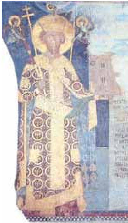
Деспот Стефан Лазаревић

У повељи краља Жигмунда из 1392 године спомиње се – districtus Lygh , а и у уговору у Тати – item districtu Ligh vocation iuxta et penes eundem districtum Neprichow existente . Жупа Пепељевац – districtus Repelwch – простирала се у доњем току реке Љига. Непричава је постојала у то доба као жупа, град Пакај и велики трг. Забележено је да је трг Непричава доносио велике приходе деспоту Стефану Лазаревићу.