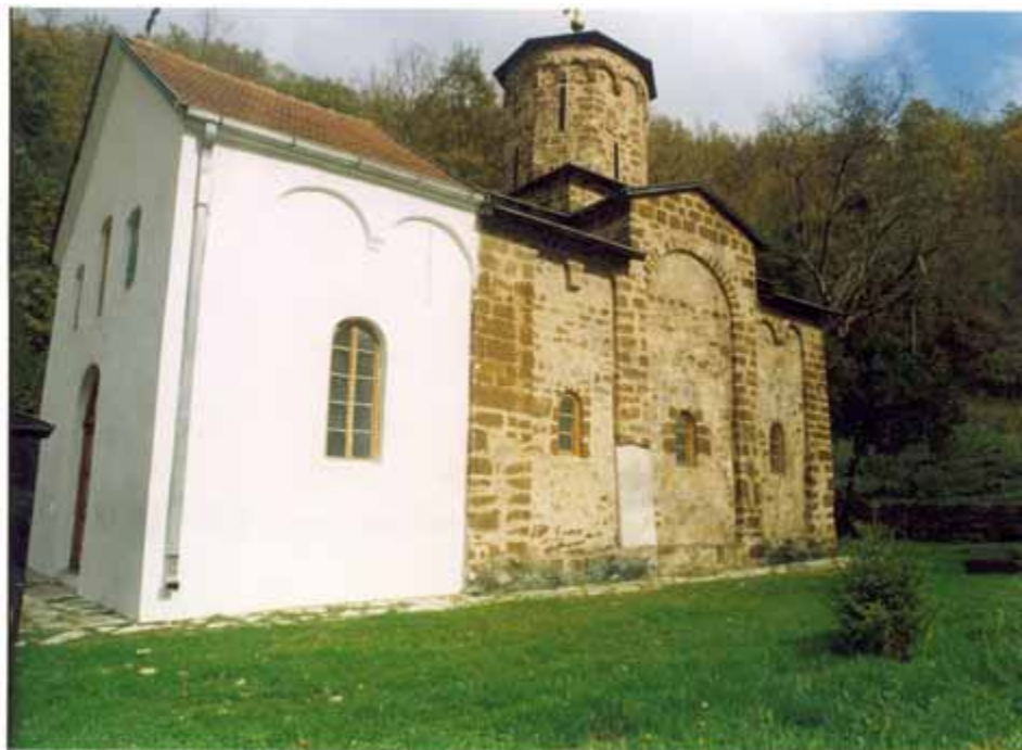
Маркова Црква

били. Сва је ова прекрасна и дивна светиња сазидана од тесаног камена, ван кубета ваљда, која су ако не зидана, а оно бар у место себре подзиђивана прекрасном препицаном опеком, смешаном са разним стварима претученом, која се још и данас употребљава као шупља за кубета над сводовима разних светиња. Прекрасан живопис са прекрасним писменима око светаца, који још остадоше са избуденим лицем и извађеним очима, од варварства и дивљег фанатизма, показиваше време напретка и славе Српске...” Црква у Петки је обновљена и у њој се врши служба почев од године 1871.