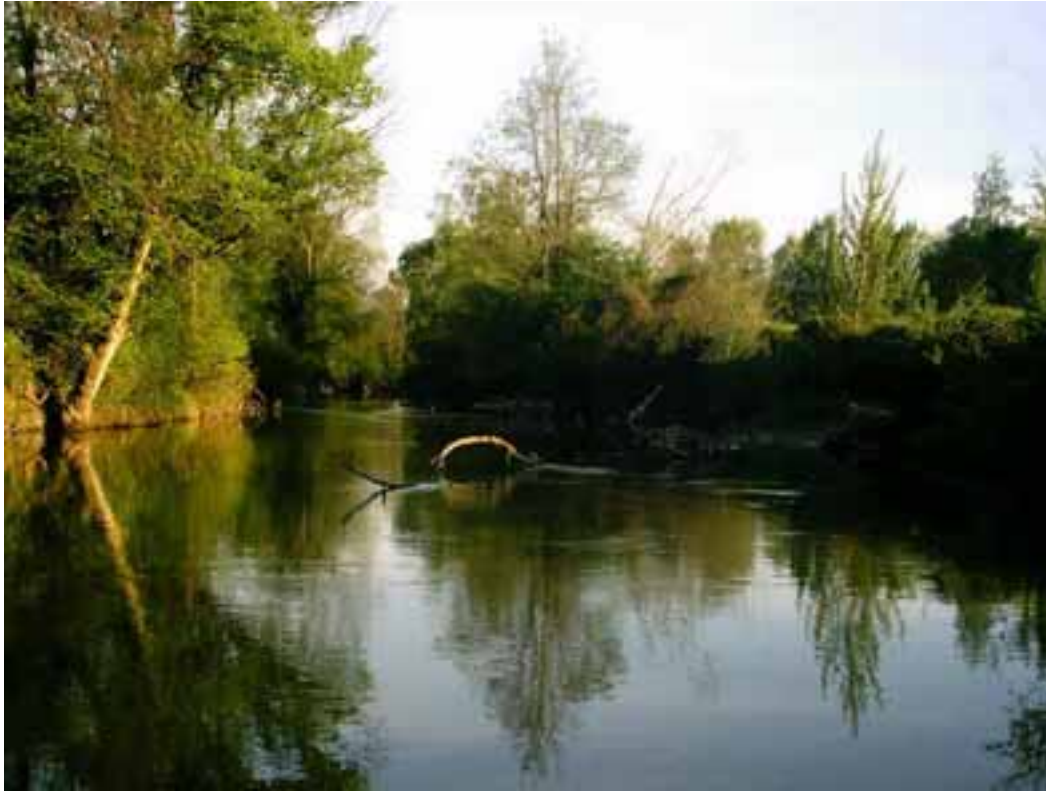
Драгутин Филиповић: Љиг

Љиг, највећа и водом најбогија притока Колубаре, према лингвистичким анализама носи прекелтско, вероватно старо- индоевропско име. У писаним изворима угарског порекла јавља се у облику “Lygh “ 1392. године , а 1426. године као “Ligh “, оба пута у имену једне жупе у Мачванској бановини. У слободном преводу значи „Светла Река“. Име реке Тамнаве је словенског порекла и означава „ Тамну Реку“.