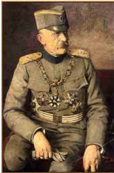
Војвода Живојин Мишић

Очекивања Српске Врховне команде да ће непријатељ привремено, прекинути своје операције испред Колубаре и Љига нису се остварила. Аустро – Угарске трупе, V и VI армија, избиле су на Ђурђиц, 16. Новембра 1914. године по постанку света, на обале Колубаре . Иако је знао да је премореним и проређеним Аустријским трупама одмор био преко потребан, генерал Поћорек је наредио да V армија и XIII корпус VI армије продуже напад без задржавања ради заузимања висова на десној обали Колубаре. Овим нападом Поћорек је тежио да се домогне железничке пруге Обреновац – Лајковац – Ваљево и њоме, уместо уским и блатњавим мочварним путевима, снабдева своје трупе.