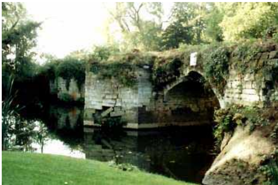
Мост Кулин Капетана